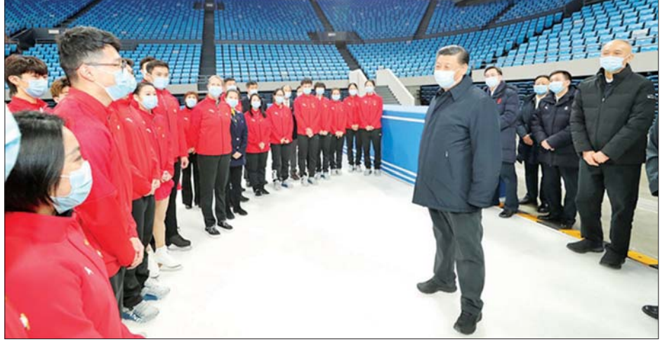
တရုတ်သမ္မတ ရှီကျင့်ဖျင် ဆောင်းရာသီအိုလံပစ်ပွဲတော် ကျင်းပရေးပြင်ဆင်ထားမှုများကို ကြည့်ရှုနေစဉ်။

ထို့အပြင် ရှီက အားကစား ပြိုင်ပွဲကို အောင်မြင်စွာကျင်းပနိုင် ခြင်းဖြင့် နိုင်ငံတကာကို လွှမ်းမိုးမှု ရရှိအောင် ဝိုင်းဝန်းကူညီကြပါဟု မီဒီယာကို တိုက်တွန်းပြောကြား လိုက်သည်။ လွန်ခဲ့သော သီတင်းပတ် နှစ်သစ်မိန့်ခွန်းတွင် ရှီက အား ကစားပြိုင်ပွဲကျင်းပရန် အဆင် သင့်ဖြစ်နေပြီဖြစ်ကြောင်း ပြော ကြားခဲ့သည်။ အင်န်အိတ်ချ်က