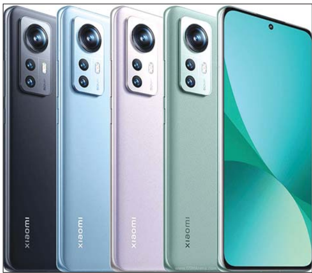
ဈေးနှုန်းပိုင်းအနေဖြင့် ပြည်တွင်းဈေးကွက်သို့ ဝင်ရောက်မလာ သေးသဖြင့် ဈေးအတိအကျကို မသိရသေးသော်လည်း နိုင်ငံတကာ ဈေးကွက်တွင် မိတ်ဆက်သည့် ဈေးနှုန်းများအရ ဖုန်းအားလုံးမှာ ကျပ် ၁၀ သိန်းကျော် ကျသင့်နိုင်သည်။ အနိမ့်ဆုံး Xiaomi 12X တွင် 8/128 က ကျပ် ၁၀ သိန်းကျော်၊ 8/256 က ကျပ် ၁၁ သိန်းကျော်၊ 12/256

စတင်ရောင်းချသော Xiaomi 12 စီးရီး စမတ်ဖုန်းသစ်သုံးမျိုးလုံးမှာ ပထမဆုံး MIUI 13 ပါဝင်လာသကဲ့သို့ ဟာ့ဒ်ဝဲပိုင်းတွင်လည်း အများစု ကြိုတင်မျှော်လင့်သလို မျက်နှာပြင်အောက်ဆယ်လီကင်မရာ မပါ သည့်အပြင် အကောင်းဆုံးစွမ်းဆောင်ရည်ကို ရရှိနိုင်မည့် တန်ဖိုးမြင့်ဖုန်း များဖြစ်သည်။ ထိုဖုန်းသုံးမျိုးတွင် Xiaomi 12 က အလယ်အလတ်ဖြစ်ကာ 12X မှာ Xiaomi 12 ကို ပိုဈေးသက်သာအောင် စွမ်းဆောင်ရည်အချို့ လျော့ချထားပြီး Xiaomi 12 နှင့် 12X တို့မှာ အရွယ်အစား တူညီသည်။ 12 Pro မှာမူ အရွယ်အစားပိုကြီးသလို စွမ်းဆောင်ရည်ပိုင်းတွင်လည်း အမြင့်ဆုံးဖြစ်ပြီး ဈေးနှုန်းလည်းအများဆုံးဖြစ်သည်။ Xiaomi 12 စီးရီး စမတ်ဖုန်းသစ်သုံးမျိုး၏ အဓိကကျသောအချက်များကို နှိုင်းယှဉ်ဖော်ပြ လိုက်ပါသည်။