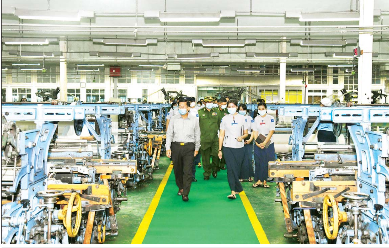
၂၀၂၁ ခုနှစ် နိုဝင်ဘာလ ၁၁ ရက်က နိုင်ငံတော်စီမံအုပ်ချုပ်ရေးကောင်စီ ဥက္ကဋ္ဌ၊ နိုင်ငံတော်ဝန်ကြီးချုပ် ဗိုလ်ချုပ်မျိုးကြီး မင်းအောင်လှိုင် တပ်မတော် ချည်မျှင်နှင့် အထည်စက်ရုံ (သမိုင်း)သို့ သွားရောက်ကြည့်ရှုစစ်ဆေးစဉ်။

နိုင်ငံတော်စီမံအုပ်ချုပ်ရေးကောင်စီ ဥက္ကဋ္ဌ၊ တပ်မတော်ကာကွယ်ရေးဦးစီးချုပ် ဗိုလ်ချုပ်မျိုးကြီး မင်းအောင်လှိုင်သည် ရုရှား - မြန်မာ စစ်ဘက်နည်းပညာ ပူးပေါင်းဆောင်ရွက်ရေးပူးတွဲကော်မရှင် ဥက္ကဋ္ဌ၊ FSMTC of Russia ၏ ဒုတိယ ညွှန်ကြားရေးမှူးချုပ် Mr.Vladimir Drozhzhov နှင့် JSC “Rosoboronexport” ကုမ္ပဏီ ဒုတိယညွှန်ကြားရေးမှူးချုပ် Mr.A.L.Chekmarev တို့ ဦးဆောင်သည့် ကိုယ်စားလှယ်အဖွဲ့အား နိုဝင်ဘာ ၁၂ ရက်က လက်ခံတွေ့ဆုံခဲ့သည်။ နှစ်နိုင်ငံ တပ်မတော်နှစ်ရပ်အကြား စစ်ဘက် နည်းပညာဆိုင်ရာ ပူးပေါင်းမှုတိုးမြှင့်နိုင် မည့်အခြေအနေ၊ ခေတ်မီမြန်မာ့ တပ်မတော်အဖြစ် အဆင့်မြှင့်တင်ရာ တွင် ရုရှားဖက်ဒရေးရှင်းနိုင်ငံမှ လူသား အရင်းအမြစ်နှင့် နည်းပညာလိုအပ်သည် များ ပိုင်းဝန်းကူညီဆောင်ရွက်ပေးခဲ့မှု၊ နှစ်နိုင်ငံ ကာကွယ်ရေးအပိုင်းတွင် ပူးပေါင်းဆောင်ရွက်မှုများအပြင် စီးပွား ရေးအပါအဝင် ကဏ္ဍပေါင်းစုံ၌