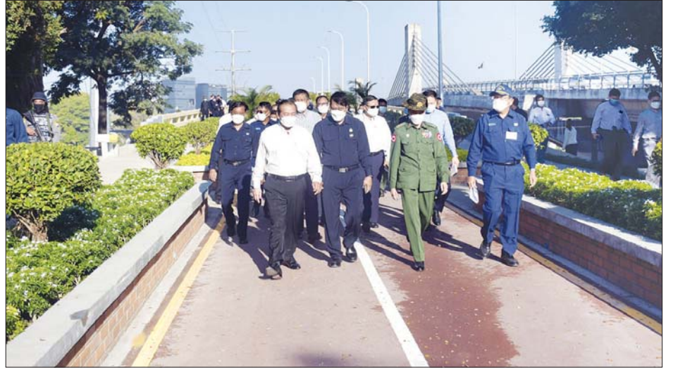
လူကူးပန်းခြံတံတားပေါ်တွင် တိုင်းဒေသကြီးဝန်ကြီးချုပ်နှင့်တာဝန်ရှိသူများ ကြည့်ရှုစစ်ဆေးစဉ်။

ဆက်လက်၍ တိုင်းဒေသကြီးဝန်ကြီးချုပ်နှင့် ဝန်ကြီးများသည် ဒဂုံမြို့သစ် အရှေ့ပိုင်းမြို့နယ်