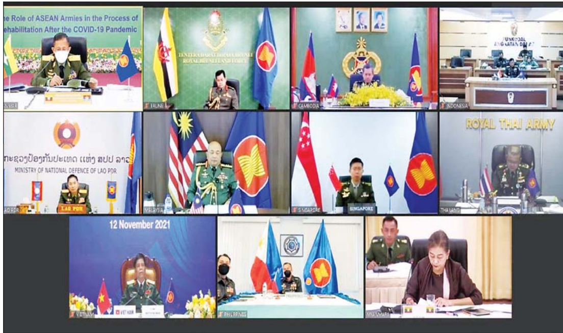
၂၀၂၁ ခုနှစ် နိုဝင်ဘာလ ၁၂ ရက်က ဗီဒီယိုကွန်ဖရင့်စနစ်ဖြင့် ကျင်းပသည့် (၂၂)ကြိမ်မြောက် အာဆီယံကြည်းတပ်ဦးစီးချုပ်များ အစည်းအဝေးတွင် နိုင်ငံတော်စီမံအုပ်ချုပ်ရေးကောင်စီ ဒုတိယဥက္ကဋ္ဌ၊ ဒုတိယတပ်မတော်ကာကွယ်ရေးဦးစီးချုပ်၊ ကာကွယ်ရေးဦးစီးချုပ်(ကြည်း) ဒုတိယဗိုလ်ချုပ်မှူးကြီး စိုးဝင်း ကိုဗစ်-၁၉ ကပ်ရောဂါအလွန် ပြန့်လည်ထူထောင်ရေးတွင် အာဆီယံကြည်းတပ်များ၏ အခန်းကဏ္ဍခေါင်းစဉ်ဖြင့် ဦးဆောင်ဆွေးနွေးစဉ်။

တော်စီမံအုပ်ချုပ်ရေး ကောင်စီအဖွဲ့ဝင်များ၊ ပြည်ထောင်စုဝန်ကြီးများ၊ အဂတိလိုက်စားမှု တိုက်ဖျက်ရေးကော်မရှင်ဥက္ကဋ္ဌ၊ တိုင်းဒေသကြီး/ ပြည်နယ်ဝန်ကြီးချုပ်များနှင့် ဒုတိယဝန်ကြီးများက သက်ဆိုင်ရာကဏ္ဍရပ်များနှင့် လုံခြုံရေး၊ တည်ငြိမ်အေးချမ်းရေးနှင့် တရားဥပဒေစိုးမိုးရေးဆိုင်ရာ ကိစ္စရပ်များအား ရှင်းလင်းတင်ပြကြသည်ကို တွေ့ရသည်။ မြန်မာနိုင်ငံ သတင်းမီဒီယာကောင်စီဝင်များ ကတိသစ္စာပြုခြင်း အခမ်းအနားကို နိုဝင်ဘာ ၂၄ ရက်က ကျင်းပရာ နိုင်ငံတော်ဝန်ကြီးချုပ် ရှေ့မှောက်တွင် ကောင်စီဝင်များက ကတိသစ္စာပြုကြသည်။ ယင်းအခမ်းအနားတွင် နိုင်ငံတော်