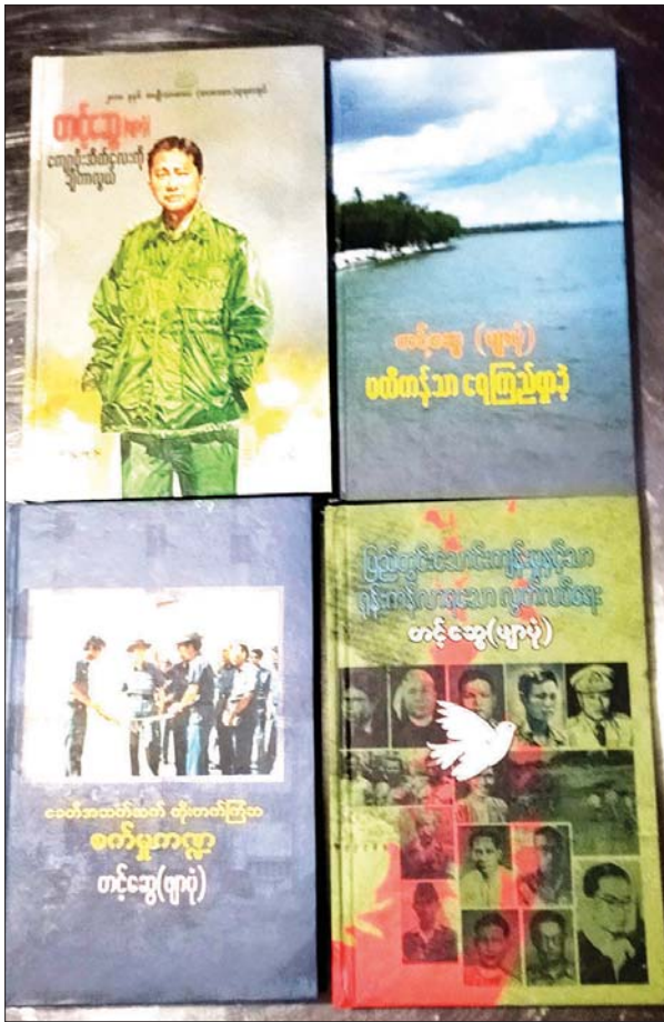
စာရေးဆရာကြီး တင့်ဆွေ(ဖျာပုံ) ရေးသားခဲ့သော စာအုပ်များ။

ယင်း ၁၉၄၈ ခုနှစ် နိုဝင်ဘာလ ၂၉ ရက်မှာပင် တစ်ရပ်တည်းနေ ဖျာပုံသူ ဒေါ်ခင်စန်းနှင့် ရေစက်ပါခဲ့ပြီး လက်ထပ်ခဲ့သည်။ နိုင်ငံ အကျိုးနှင့်အတူ အိမ်ထောင်မှုတစ်ခုကိုလည်း အေးချမ်းစွာ တည်ဆောက်ရင်း ဗိုလ်မှူးချုပ်အဆင့်ဖြင့် ၁၉၈၀ ပြည့်နှစ်တွင် အငြိမ်းစားယူခဲ့သည်။ တပ်မတော်တွင် တပ်ရင်းမှူး/ တပ်မမှူး / တိုင်းမှူး စသည့် တာဝန်အဆင့်ဆင့်တို့ကို ထမ်းဆောင်ခဲ့ပြီး မြန်မာနိုင်ငံ၏ ပထမဆုံး သော ခြေမြန်တပ်မဖြစ်သည့် အမှတ်(၇၇) တပ်မကို ဦးဆောင်ဖွင့်လှစ် တည်ထောင်ခဲ့သူလည်းဖြစ်သည်။ ယင်းနှင့်တစ်ပြိုင်နက် ပဲခူးရိုးမမှ ဗကပ ဗဟိုဌာနချုပ်အား ဖြိုခွင်းနိုင်ခဲ့သော မှတ်တမ်းကောင်း ရာဇဝင်