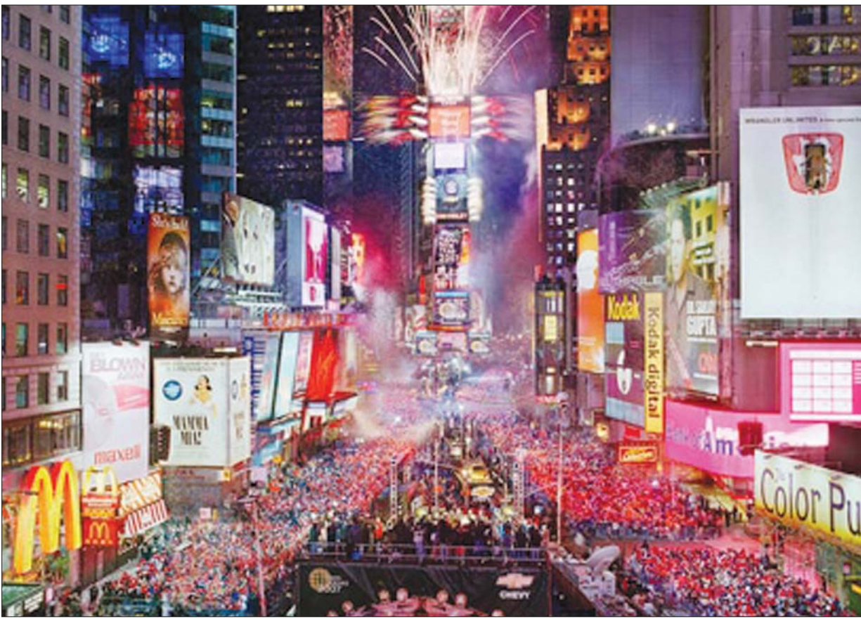
ယခင်နှစ်များက နယူးယောက်စီးတီး၏ နှစ်သစ်ကူးမြင်ကွင်းကို တွေ့ရစဉ်။

ပြင်သစ်နိုင်ငံမှာလည်း ခရစ္စမတ်ကာလကတည်းက ကိုဗစ်-၁၉ ကူးစက်ဖြစ်ပွားမှုတွေ ရုတ်တရက်မြင့်တက်လာခဲ့တာဖြစ်ပါတယ်။ ဗြိတိန်မှာလည်း ကိုဗစ်-၁၉ ကူးစက်ဖြစ်ပွားမှုတွေ မြင့်တက်လာပြီး ၁၂ သန်းကျော်အထိရှိလာခဲ့ပါတယ်။ ဂျာမနီမှာလည်း သောကြာနေ့ တစ်နေ့တည်းကို ကိုဗစ်-၁၉ ကူးစက်ဖြစ်ပွားသူ ၄၁၂၄၀ အထိ မြင့်တက်လာခဲ့ပါတယ်။ အိုမီခရစ်ဗိုင်းရပ်စ်သစ်ကူးစက်ဖြစ်ပွားမှု