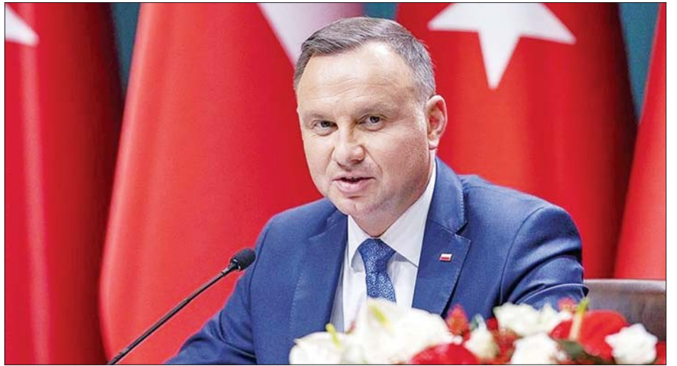
ကိုဗစ်-၁၉ ရောဂါ ကူးစက်ခံခဲ့ရသည့် ပိုလန်သမ္မတ။

ကျန်းမာရေးဝန်ကြီး Adam Niedzielski က ဇန်နဝါရီနှောင်းပိုင်းတွင် ကိုဗစ်-၁၉ ရောဂါ ကူးစက် ဖြစ်ပွားမှု အမြင့်ဆုံးအထိ ရောက်ရှိလာနိုင်ကြောင်း၊ ထို့ကြောင့် ကြီးမားလှသည့် ကပ်ဘေးကြီးအတွက် ကြိုတင်ပြင်ဆင်ထားရန် လိုနေပြီဖြစ်ကြောင်း ဇန်နဝါရီ ၅ ရက်က ပြောကြားလိုက်သည်။ အေအက်ဖ်