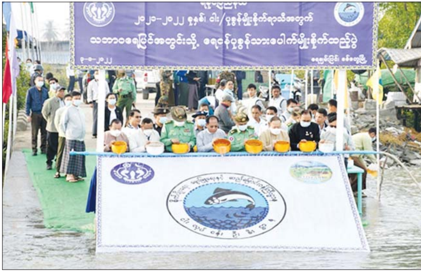
ပေါက်တောမြို့နယ် စိုးမဲကျိကျေးရွာအနီး ကောင်ရေ ၅၈၀၀၀၀ နှင့် မျိုးပုစွန် အမ သုံးကောင်ကို မျိုးစိုက်ထည့်ပေးခဲ့ကြောင်း သိရသည်။ သတင်းစဉ်

ငါးမျိုးစိုက်ထည့်ပွဲတွင် ပြည်နယ် ငါး လုပ်ငန်းဦးစီးဌာနမှူး ဦးသက်ဦးက ရေငန်ပုစွန် များ သာဘာဝရေပြင်အတွင်း မျိုးစိုက်ထည့်ခြင်း နှင့် ပတ်သက်၍ ရှင်းလင်းပြောကြားပြီး ရခိုင် ပြည်နယ်ဝန်ကြီးချုပ် ဒေါက်တာအောင်ကျော် မင်း၊ အနောက်ပိုင်းတိုင်းစစ်ဌာနချုပ် တိုင်းမှူး၊ ပြည်နယ်ဝန်ကြီးများ၊ ပြည်နယ်ဥပဒေချုပ်၊ ဌာနဆိုင်ရာတာဝန်ရှိသူများက ရေချမ်းပြင် ကျေးရွာအနီး မင်းဂံချောင်းအတွင်းသို့ ရေငန် ပုစွန်သားပေါက်ကောင်ရေ ၃၆၀၀၀၀ နှင့်