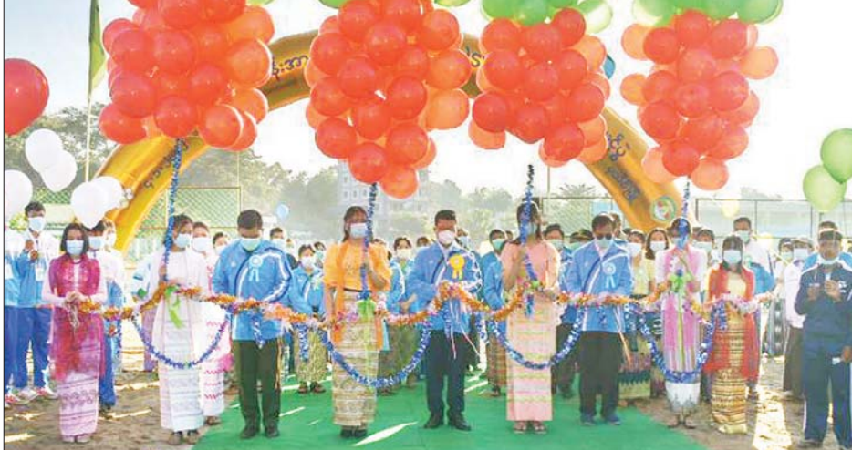
တင် ဆောင်ရွက်ပေးသည်။ ဆက်လက်၍ တိုင်းဒေသကြီး ဝန်ကြီးချုပ်နှင့် အဖွဲ့သည့် တိုင်းဒေသကြီး ဝန်ကြီးချုပ်ဖလား ၂၆ မြို့နယ် အသက် ၂၅ နှစ်အောက် ပြေးခုန်ပစ်ပြိုင်ပွဲ ဗိုလ်လုပွဲများနှင့် လွတ်လပ်ရေးနေ့အထိမ်းအမှတ် အားကစားပြိုင်ပွဲများကို ကြည့်ရှုအားပေးပြီး ဆုများ ချီးမြှင့်ကြောင်း သိရသည်။ ကိုတွတ်(ပြန်/ဆက်)

ပြေးလမ်းကို လှည့်လည်ကြည့်ရှုသည်။ အဆိုပါပြေးလမ်းကို ၂၀၂၀-၂၀၂၁ ဘဏ္ဍာနှစ် ပြည်ထောင်စုခွင့်ပြုရန်ပုံငွေကျပ် ၉၄၀ ဒသမ ၅ သန်း အကုန်အကျခံကာ ဆောက်လုပ်ခဲ့ခြင်းဖြစ်သည်။ ထို့နောက် အဆိုပါအားကစားကွင်းအတွင်း ၂၀၂၁-၂၀၂၂ ဘဏ္ဍာနှစ်ပထမခြောက်လဘတ်ဂျက် ရော့တတီ တိုင်းဒေသကြီးအစိုးရအဖွဲ့၏ ငွေလုံးငွေရင်းရန်ပုံ ငွေဖြင့် တင်ဒါအောင်မြင်သည့် ကောင်းကျော်ကြား ကုမ္ပဏီက တာဝန်ယူတည်ဆောက်မည့် (၅၀x ၃၂) ပေ GYM ခန်းမ RCC နှစ်ထပ်ဆောက်လုပ်မည့် အဆောက်အအုံကို တိုင်းဒေသကြီး ဝန်ကြီးချုပ်နှင့် တာဝန်ရှိသူများက သတ်မှတ်နေရာများတွင် ပန္နက်